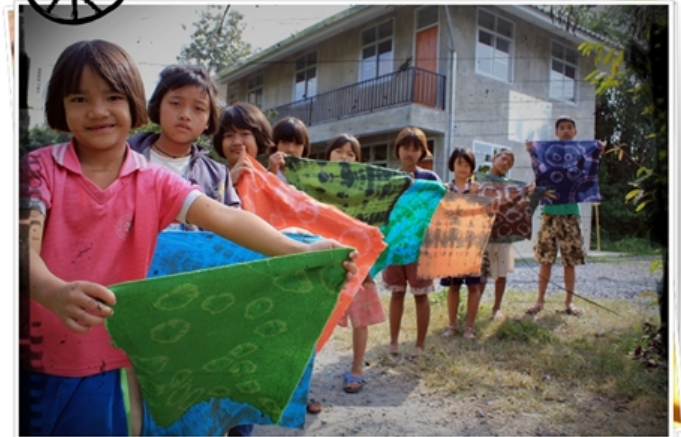
The Volunteers for Children Development Foundation